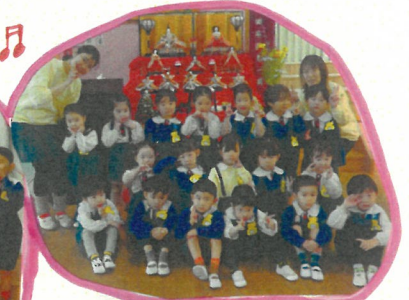
ひな人形とピースお

ひなまつり音楽会は「ホ・ホ・ホ」を歌いました。本番の2.3日前から、1番と2番の歌詞が入れ替わって歌うようになってしまい、ドキドキで当日を迎えましたが、さすがたんぽぽ組さん！本番はしっかりと歌うことができました。ホ・ホ・ホ・ホ・ホ ユーレ ユーレ ユーレ ユーレの踊りがとってもかわいかったですね。発表後は、ひなあられと、白酒のかわりにカルピスでひなまつりをお祝いしました。ひなあられもカルピスも最高！と大喜びでした。